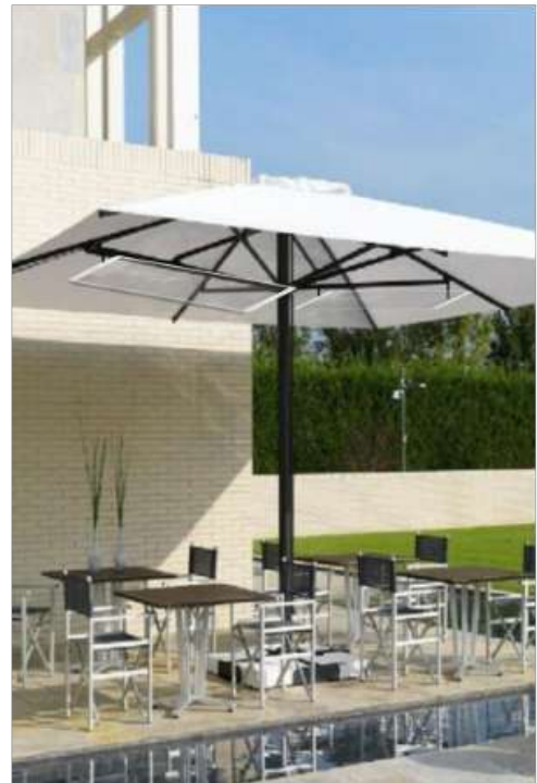
PARTICOLARE INSTALLAZIONE SU OMBRELLONE